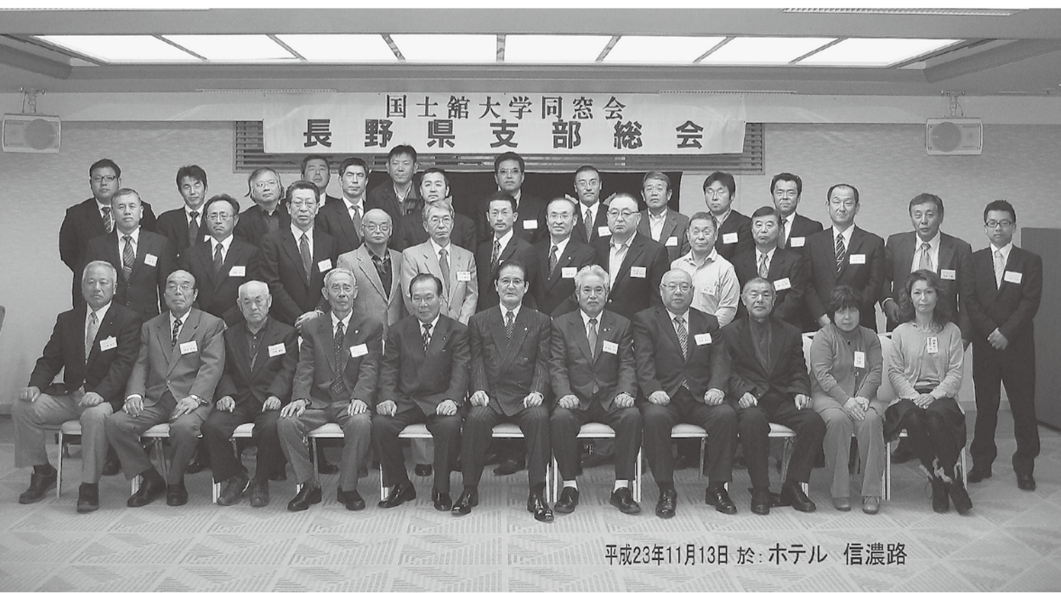
平成23年11月13日 於: ホテル 信濃路

の肩揉みやお灸の手伝いをしていました。が、手伝いと言っても、お灸の後の残った場所にモグサを置いて線香で火をつけるだけですけど。この1月に何十年かぶりで小学校の同級会がありました。担任の先生にもお二人に来ていただき、二次会まで大変盛り上がりました。社長さんなど皆さん偉く、さんなど皆さん偉く、なっているようです。一番の出世頭はなんと担任の先生でした。二年から四年までの担任の先生で、『好きこそものの上手なれ』が口癖の生徒に大人気の先生でし