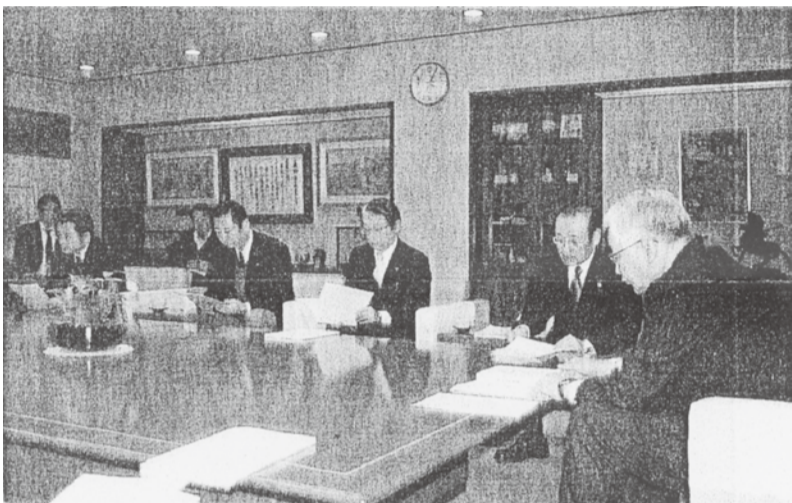
包括外部監査結果を報告する風間外部監査人(右から2人目)

監査テーマは「長野市及び外郭団体等の消費税等の検証」。消費税法上、地方公共団体や公共・公益法人等は一般の法人と比べ特定収入(租税、補助金、会費、寄付金等の対価のない収入)によって賄われる課税仕入れ等に係わる税額を仕入控除税額の対象から除外する制度があり、その処理が複雑な仕組みになってい